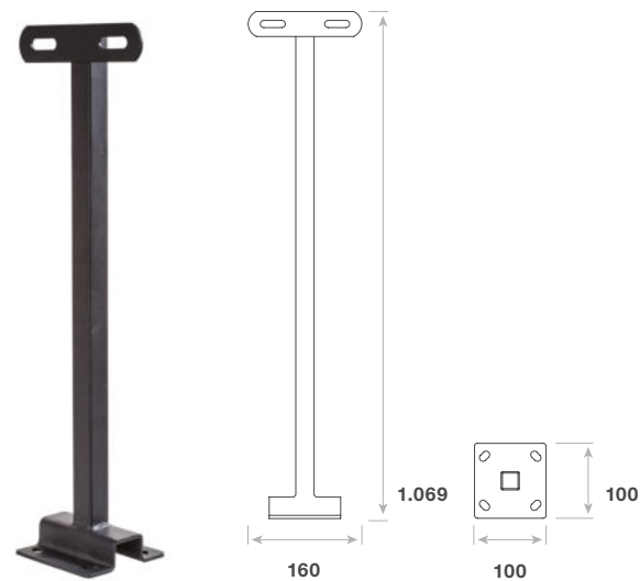
Abmessungen in mm