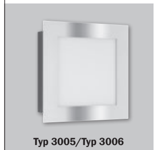
Typ 3005/Typ 3006

Leuchtmittel Typ 3006 und Typ 3007: 1x LED 12 Watt