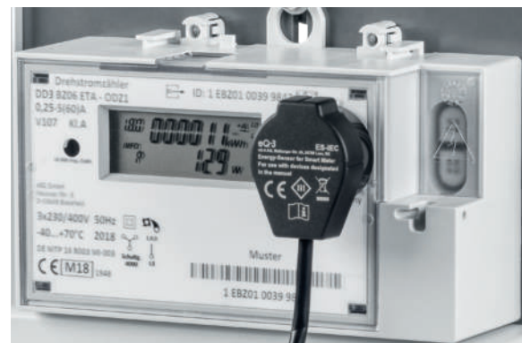
Montage an einem Stromzähler

Übertragen werden alle Zählerstände sowie die Momentanleistung. Das Gerät lässt sich in Verbindung mit Bezugs- und Lieferzählern, Zweirichtungszählern, Eintarif- und Zweitarifzählern verwenden.