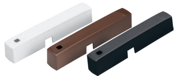
Farbvarianten in Weiß, Braun und Anthrazit