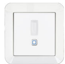
GIRA Standard 55