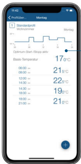
Individuelle Heizprofile über die kostenlose Homematic IP App